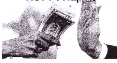
О ФАКТАХ КОРРУПЦИИ СООБЩАЙТЕ ПО ТЕЛЕФОНАМ «ГОРЯЧИХ ЛИНИЙ»